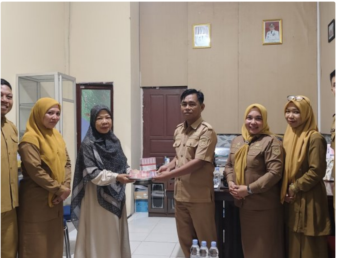
Ketua Umum PGRI Mamuju Tengah Menyerahkan Rp.122.680.500.- Untuk Korban Bencana Aceh dan Sumatra